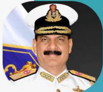
വൈസ് അഡ്മിറൽ ദിനേശ് കെ. ത്രിപാഠി