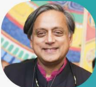
ഡോ. ശശി തരൂർ