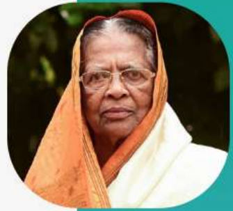
ജസ്റ്റിസ് ഫാത്തിമ ബീവി