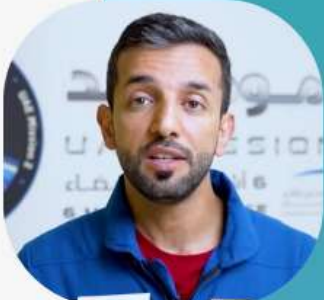
സുൽത്താൻ അൽ നെയാദി