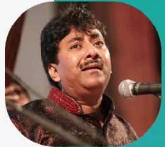
ഉസ്താദ് റാഷിദ് ഖാൻ

▷ 2024 ജനുവരിയിൽ അന്തരിച്ച വിഖ്യാത ഹിന്ദുസ്ഥാനി സംഗീതജ്ഞനും പത്മഭൂഷൺ ജേതാവുമായ വ്യക്തി ഉസ്താദ് റാഷിദ് ഖാൻ