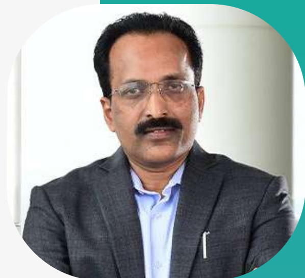
ഡോ. എസ്. സോമനാഥ്

▷ 2024 ജൂലൈയിൽ വിശ്വേശ്വരയ്യ സാങ്കേതിക സർവകലാശാലയുടെ ഓണററി ഡോക്ടറേറ്റ് നേടിയ ശാസ്ത്രജ്ഞൻ ഡോ. എസ്. സോമനാഥ് (ഐ.എസ്.ആർ.ഒ. ചെയർമാൻ)