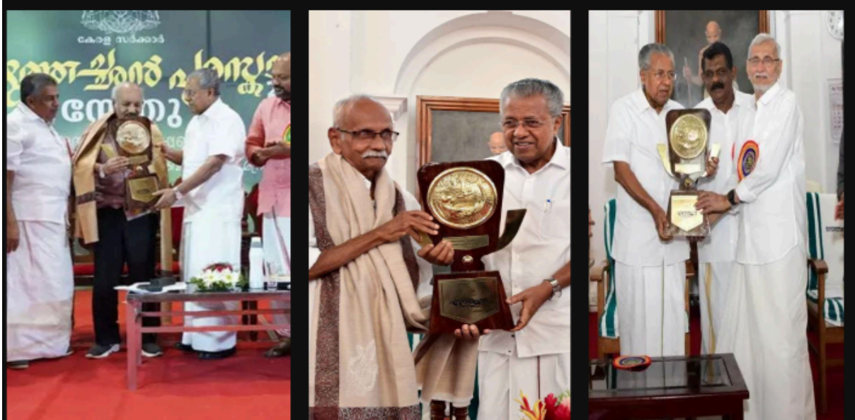
2022 - സേതു